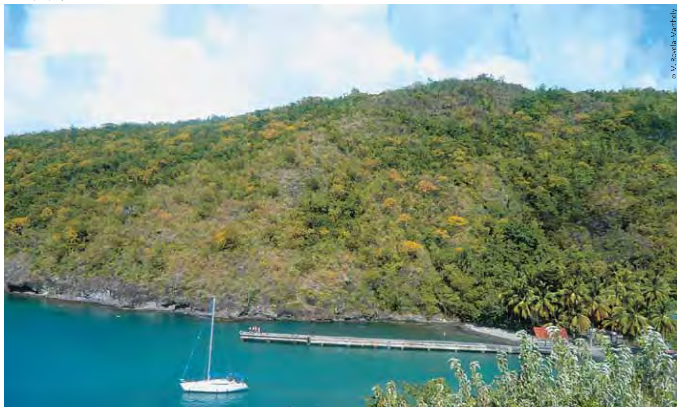
Martinique, plage de l'Anse noire - commune des Anses d'Arlet

Service d'aide à la mobilité bancaire. En application des principes adoptés par le Comité Consultatif du Secteur Financier le 28 mai 2008, les banques françaises se sont engagées à mettre en place un service d'aide à la mobilité bancaire. La banque dans laquelle un client vient d'ouvrir un nouveau compte de