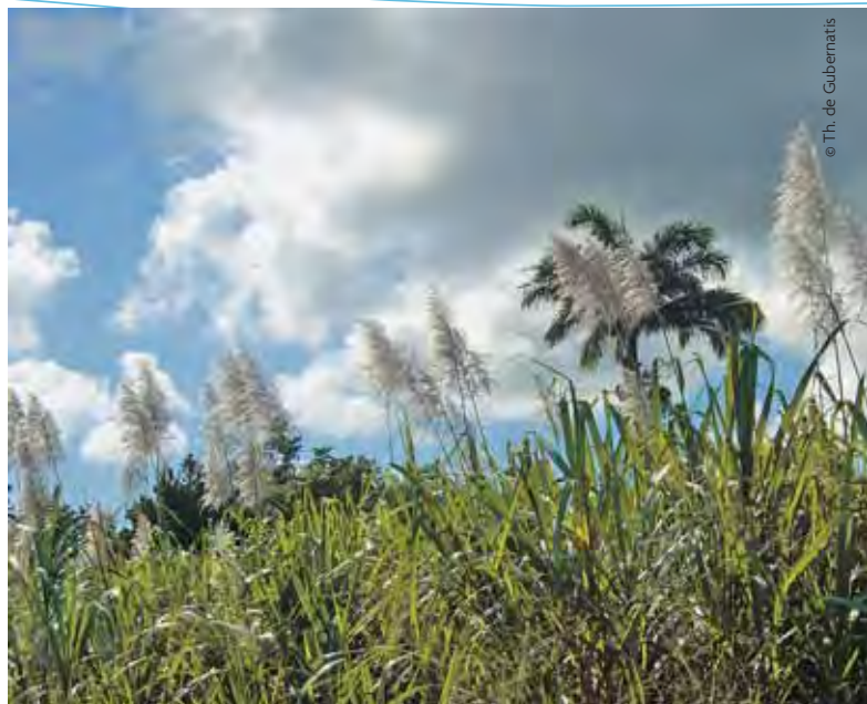
Guadeloupe, fleurs de cannes à sucre

DCOM: mise en place d'une aide au fret. La Commission européenne a autorisé la mise en place de l'aide au fret jusqu'en 2013. Le plan de 500 millions d'euros d'aide servira à compenser les handicaps (insularité et éloignement) des régions ultrapériphériques.