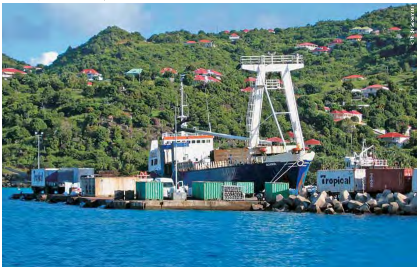
Saint-Barthélemy, zone de fret - zone technique