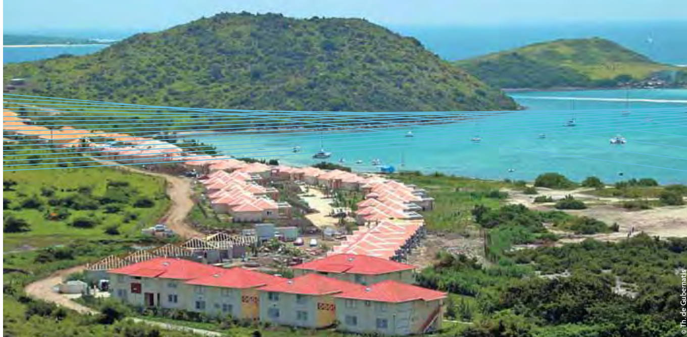
Saint-Martin, BTP - Baie orientale