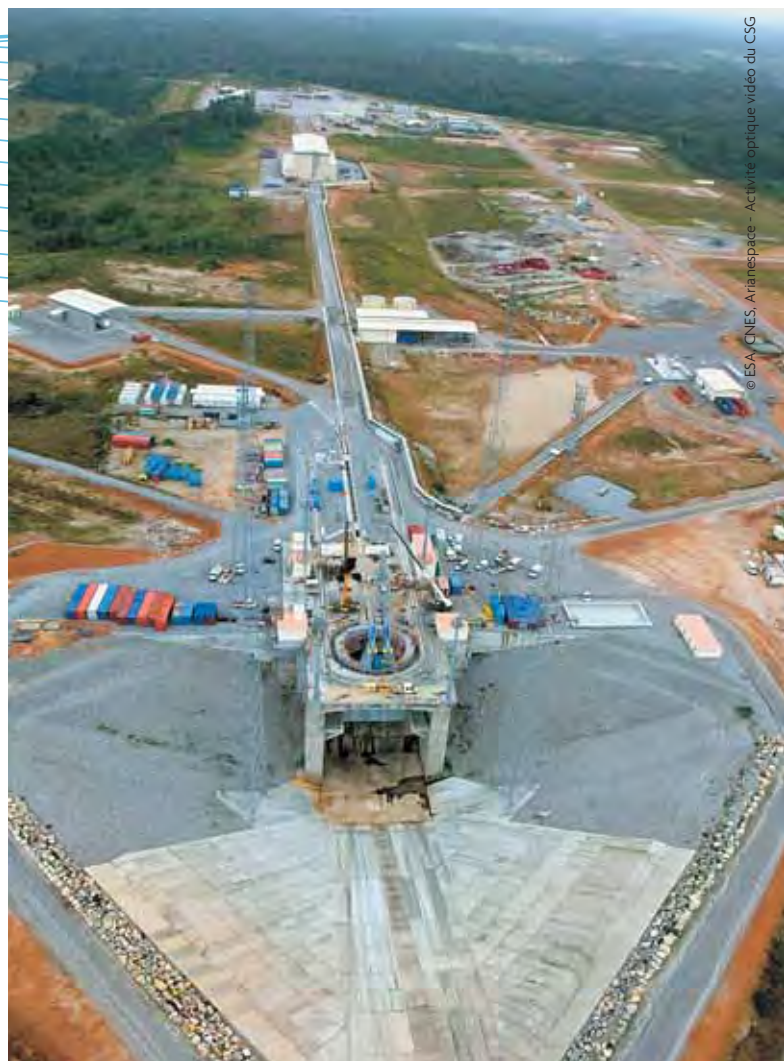
Guyane, chantier Soyouz

La Réunion : tenue des Assises du tourisme. Les Assises du tourisme de La Réunion se sont tenues le 12 septembre en présence du secrétaire d'État au Tourisme, Hervé Novelli. Le rapport final d'Odit France (cabinet d'études rattaché au ministère du Tourisme) concernant le plan de relance du tourisme à La Réunion préconise, afin d'atteindre 512 000 touristes à l'horizon 2012, la construction de 600 à 800 chambres réparties entre 2 à 3 hôtels de grande capacité (200 chambres), 10 hôtels haut de gamme et 4 hôtels emblématiques sur des sites d'exception.