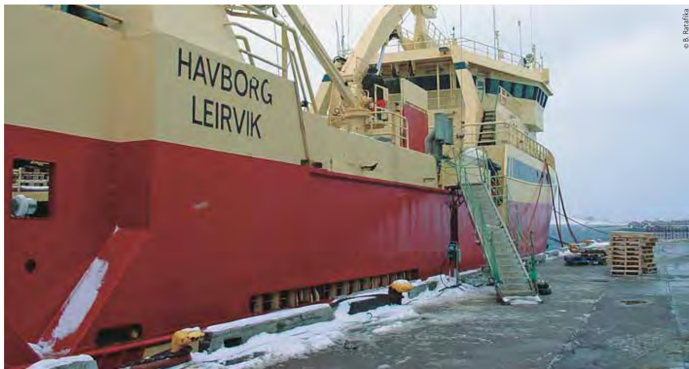
Saint-Pierre-et-Miquelon, transbordement de crevettes

DCOM : tenue à Saint-Denis de La Réunion du séminaire « L'Union Européenne et l'Outre-mer : stratégies face au changement climatique et à la perte de biodiversité » sous la Présidence française du Conseil de l'Union européenne. Organisée par l'Union internationale pour la conservation de la nature (UICN), l'Observatoire national sur les effets du réchauffement climatique (ONERC), le Conseil régional de la